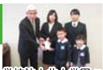
学校法人北上学園様