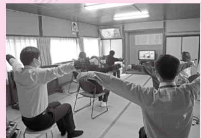
地域の方と「きたかみいきいき体操」体験中!