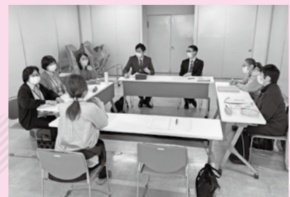
毎月、生活支援コーディネーター連絡会議を開催し、情報交換を行っています