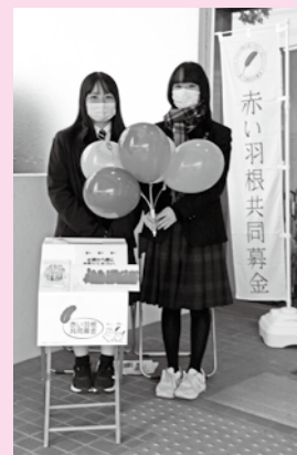
昨年度の街頭募金運動の様子です