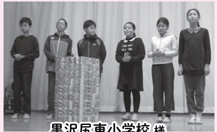
黒沢尻東小学校様