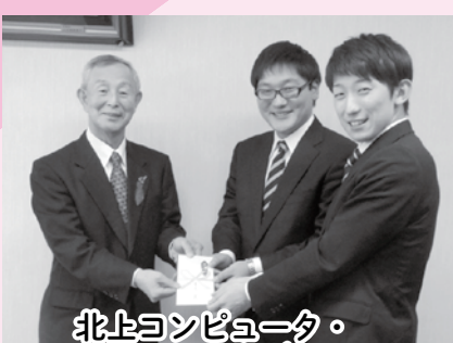
北上コンピュータ・アカデミー様