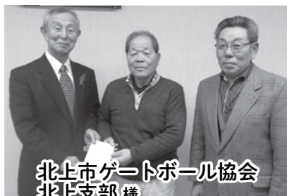
北上市ゲートボール協会 北上支部様