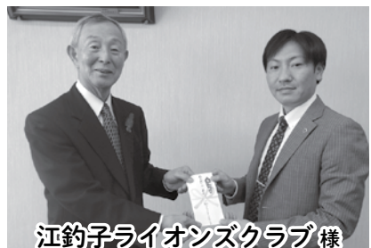
江釣子ライオンズクラブ様