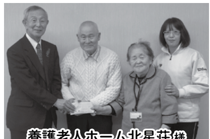
養護老人ホーム北星荘様