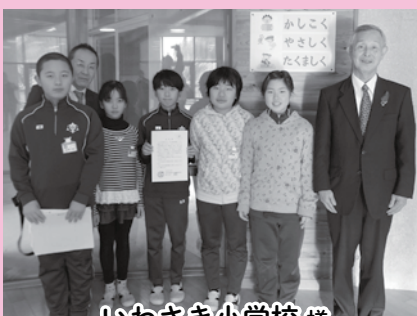
いわさき小学校様