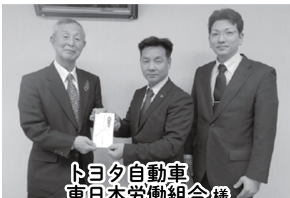
トヨタ自動車 東日本労働組合様