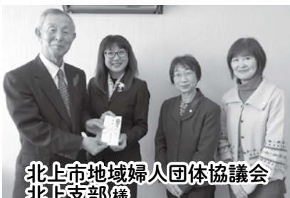
北上市地域婦人団体協議会 北上支部様