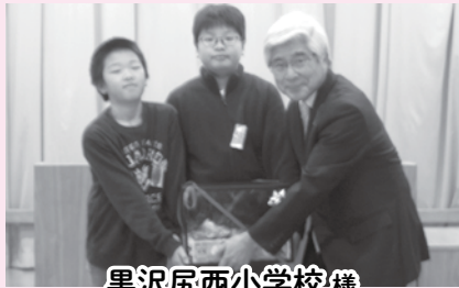
黒沢尻西小学校様