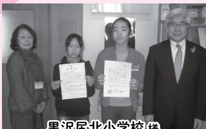
黒沢尻北小学校様