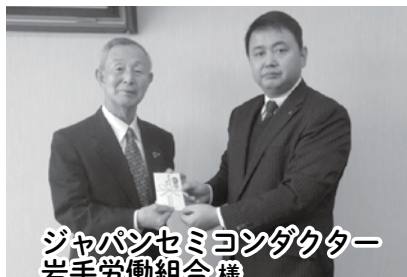
ジャパンセミコンダクター 岩手労働組合様