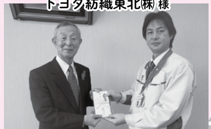
トヨタ紡織東北(株)様