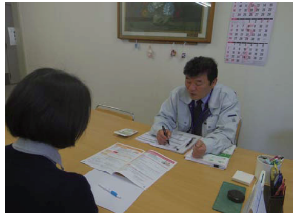
なんでも心配ごと相談センター事業 (相談対応の様子)