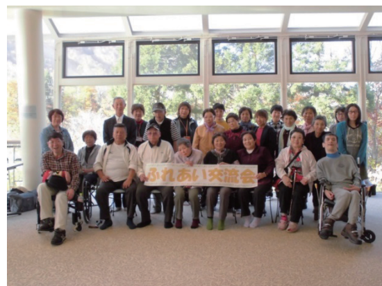
障がい者等リフレッシュ事業 (ふれあい交流会)