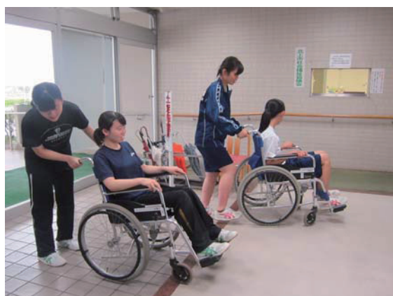
ボランティア講座