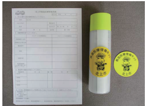
救急医療情報キット配布事業