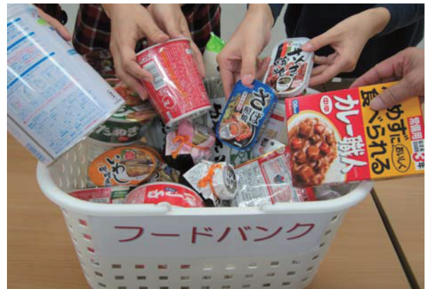
フードバンク運営事業