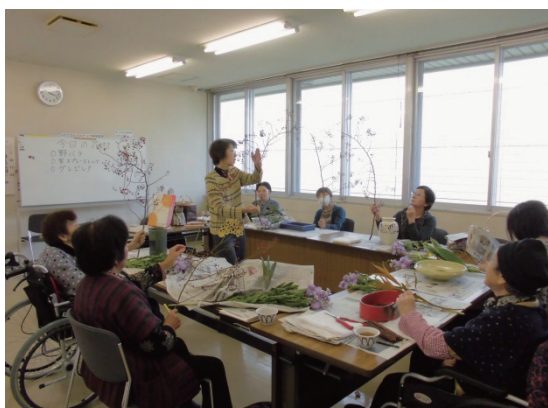
障害者地域活動支援センター事業 (生花教室)