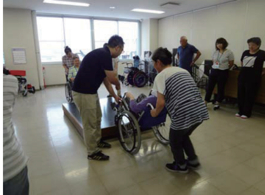
社協出前講座 (病気及び障がい理解編)