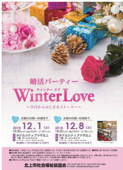
出会いの場づくり事業 (婚活パーティーのポスター)