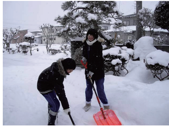
ふれあいのまちづくり事業及び地域住民 グループ支援事業 (除雪活動)