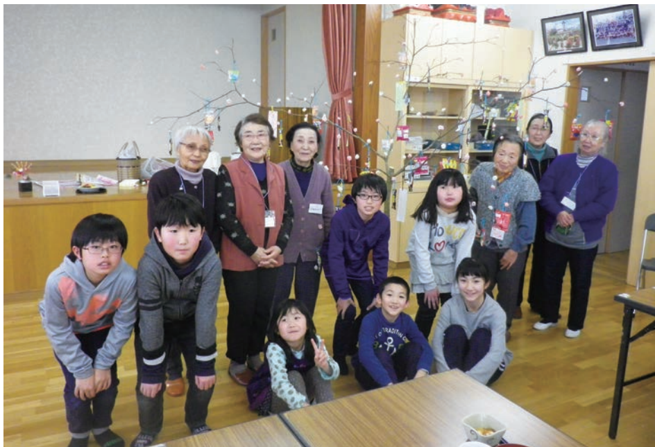
ふれあいデイサービス事業