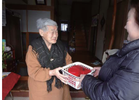
在宅高齢者等配食サービス事業