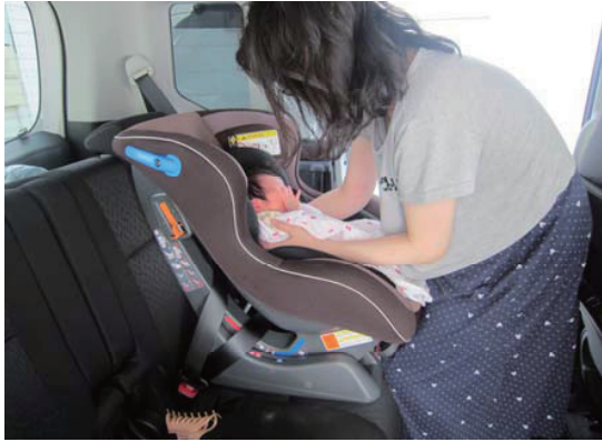
チャイルドシート貸出事業