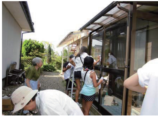
ハウスクリーニング☆プロジェクト