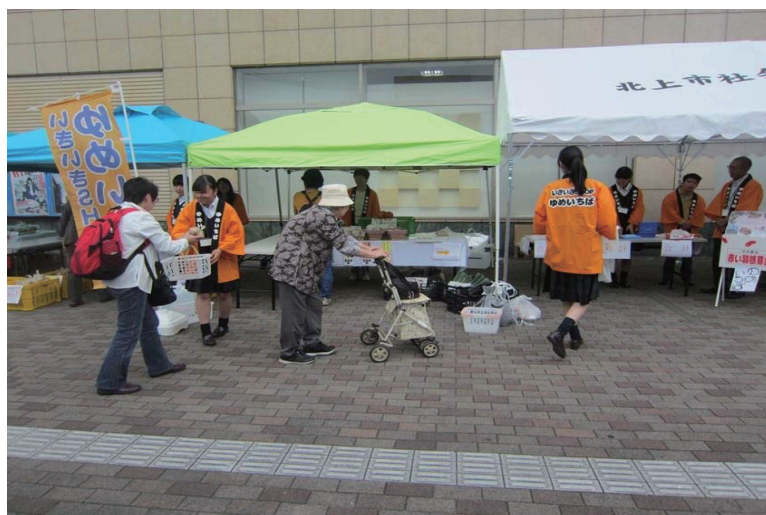
いきいきショップ☆ゆめいちば