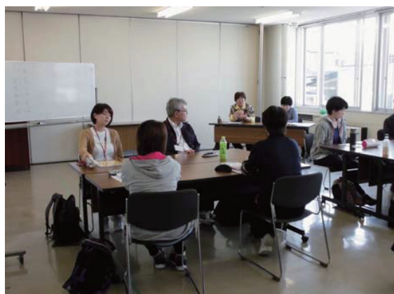
同行援護従業者養成研修