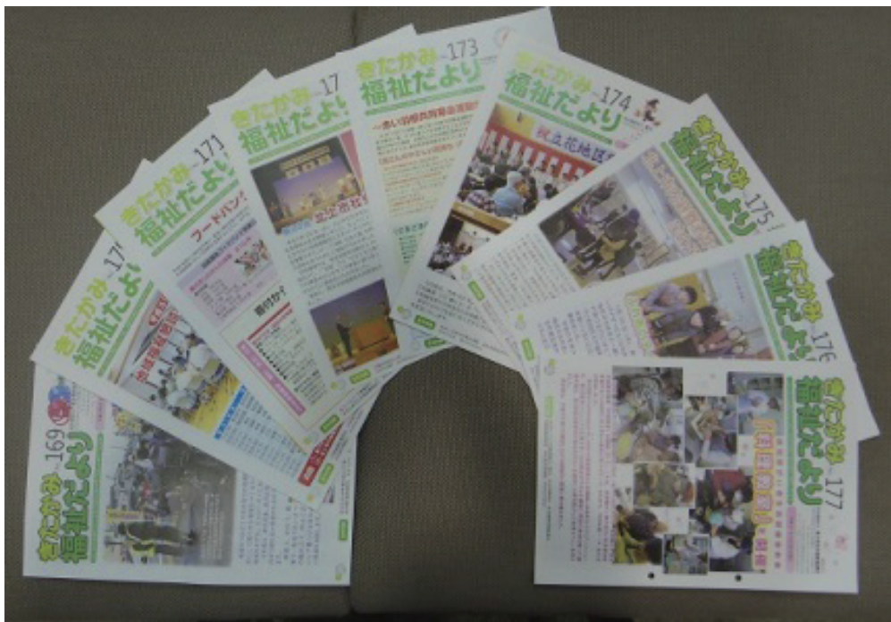
社協だより（旧福祉だより）