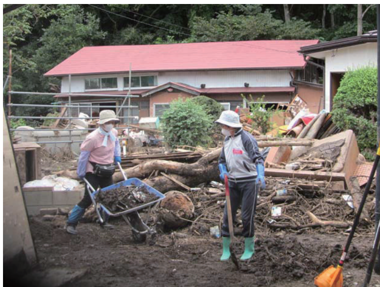
災害ボランティアセンター事業 (災害支援活動)