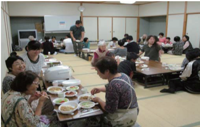
地域まるまる食堂 (子ども食堂) 事業