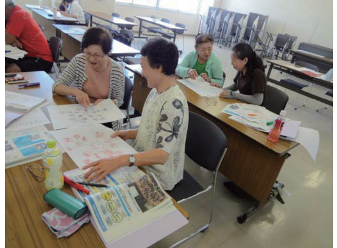
生活支援コーディネーター活動事業 (ご近所おたすけサポーター養成講座の様子)