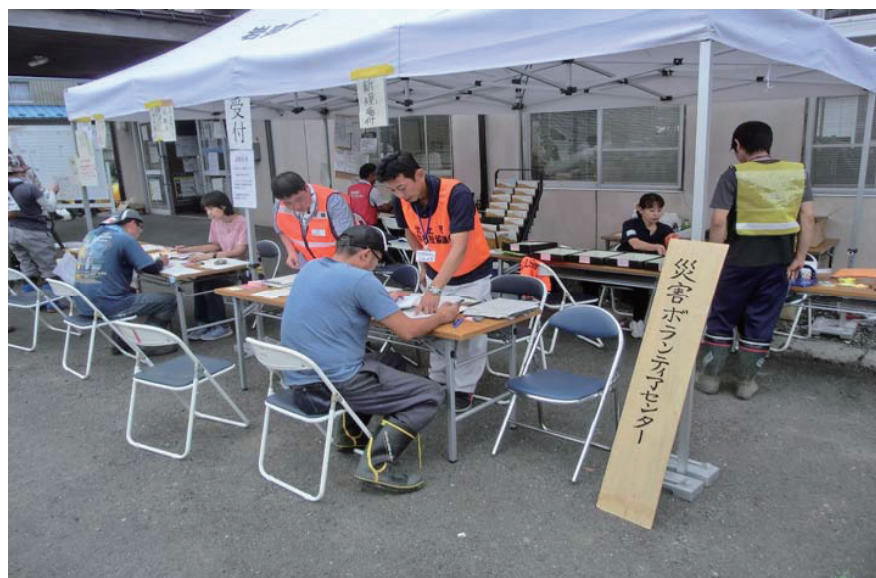
災害ボランティアセンター事業 (岩泉町災害ボランティアセンターでの活動の様子)