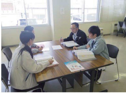
地域ふくし課題解決ネットワーク事業 (コミュニティソーシャルワーカー打ち合わせの様子)