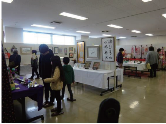
避難者生活支援センター事業 (作品展示会)