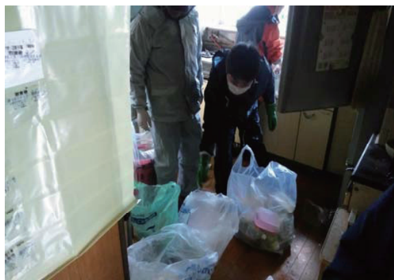
住まいの片付け応援事業