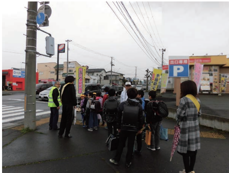
あいさつ運動推進事業