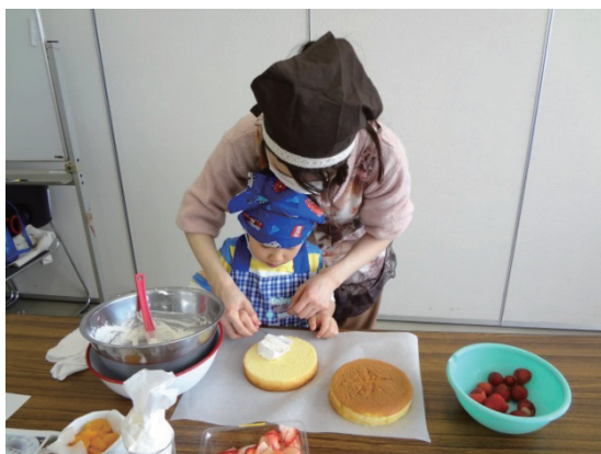
ひとり親家庭支援事業 (親子すまいるクッキング)