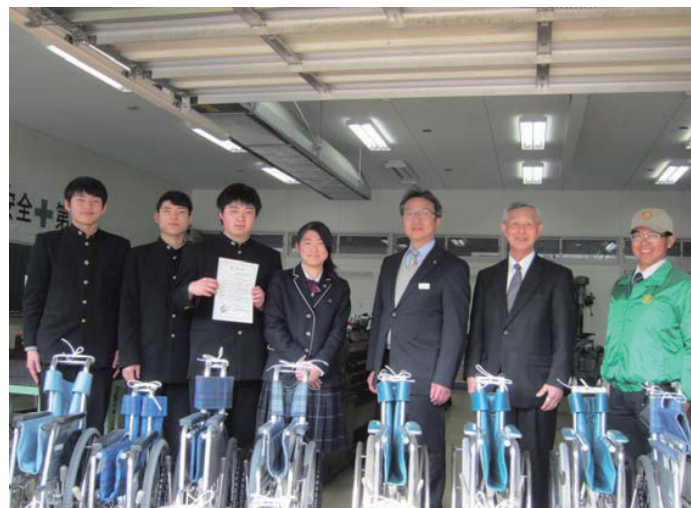
車いす修理ボランティア事業