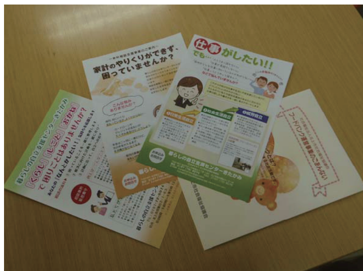
各種パンフレット