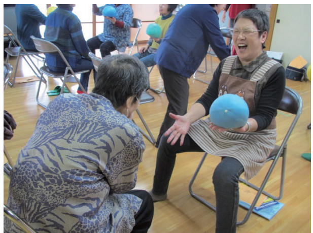
ふれあいデイサービス事業（各地区の様子）