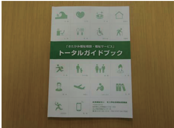
トータルガイドブック作成事業