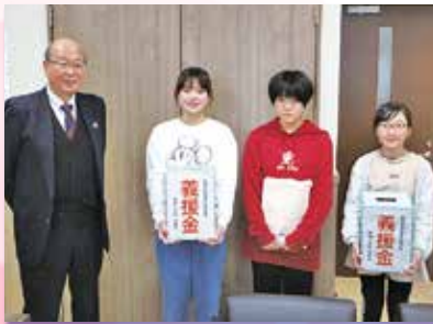
◀ 東桜小学校 様