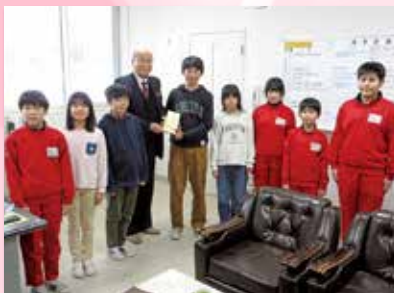
▲ 南小学校 様