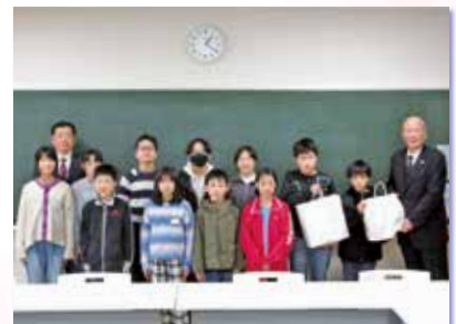
▲ 笠松小学校 様

● 当広報紙内で、問い合わせ先電話番号の記載がない記事については、全て下記にお問い合わせください。