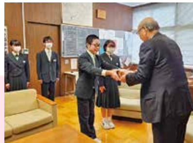
▲ 和賀西中学校 様 ◀ 東陵中学校 様