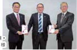
北上信用金庫 様・フコクしんらい生命保険(株) 様