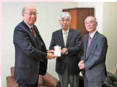
▲ 北上市グランドゴルフ 様