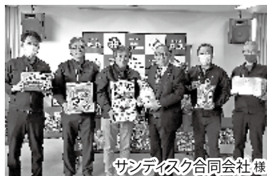
サンディスク合同会社様