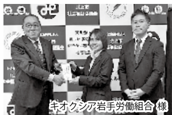
キオクシア岩手労働組合 様