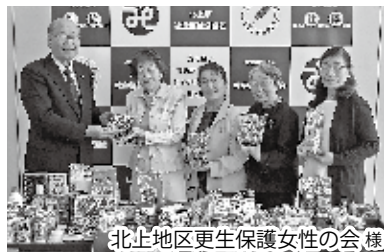
北上地区更生保護女性の会様