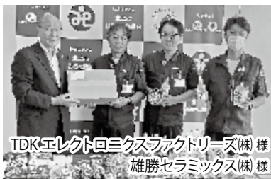
TDKエレクトロニクスファクトリーズ(株)様 雄勝セラミックス(株)様