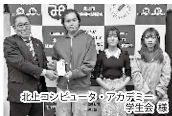
北上コンピュータ・アカデミー 学生会 様