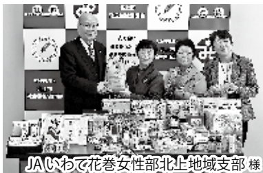
JAいわて花巻女性部北上地域支部様