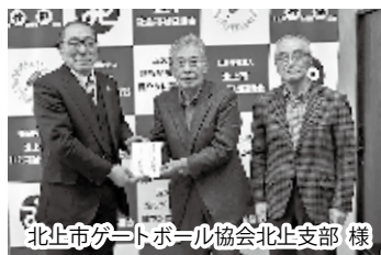
北上市ゲートボール協会北上支部 様