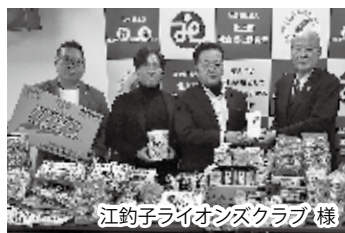
江釣子ライオンズクラブ 様