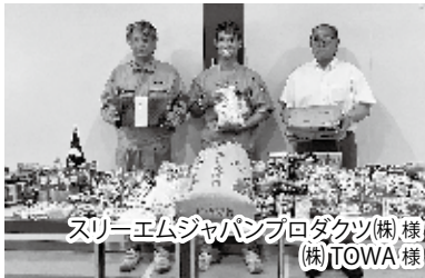
スリーエムジャパンプロダクツ(株)様 (株)TOWA様